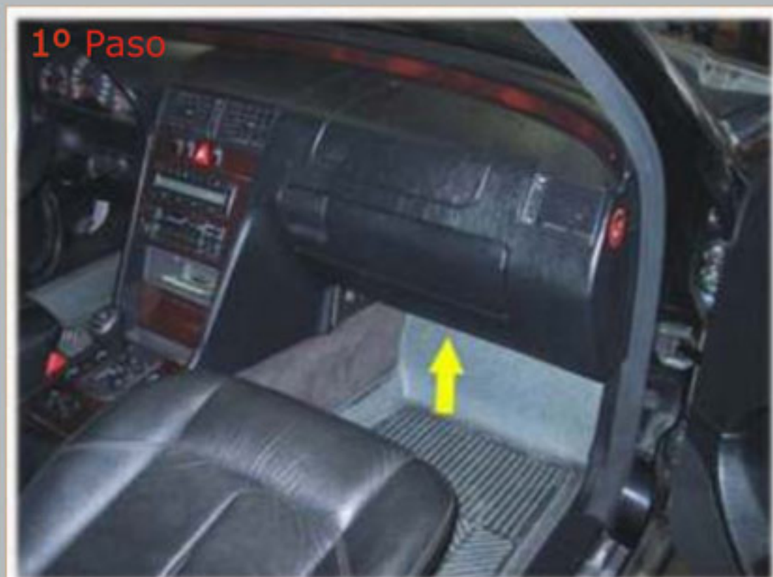
El filtro está ubicado debajo de la guantera..