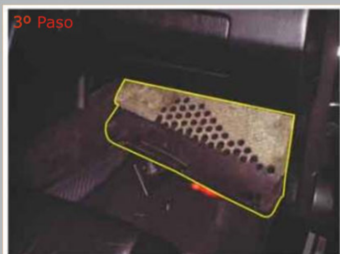
Remueva el acabado.