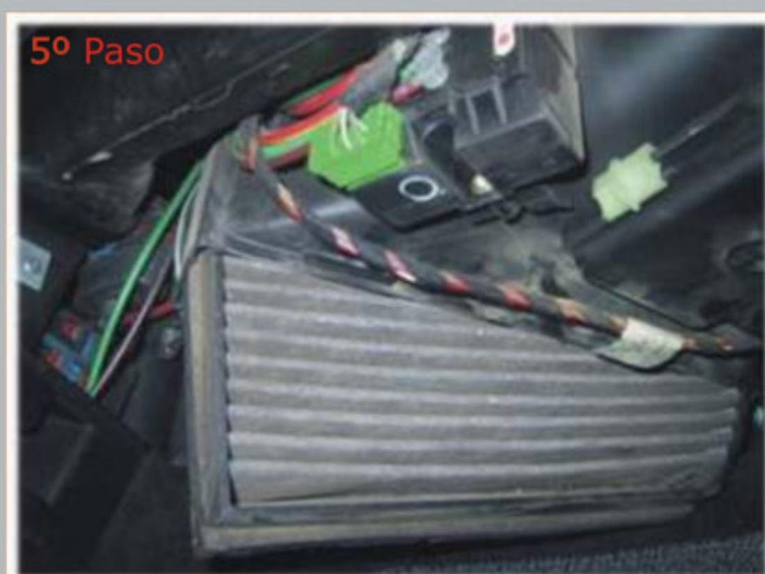
Cambie el filtro e invierta las etapas para colocarlo.