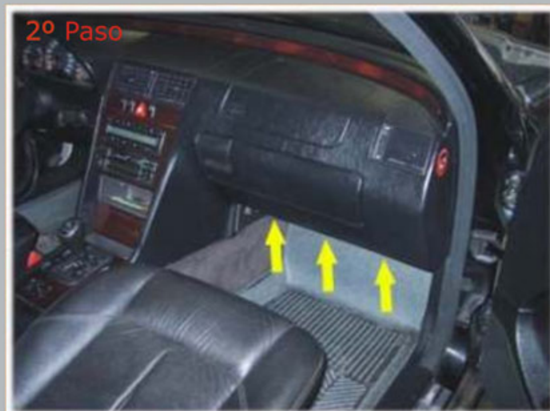
Retire los tornillos indicados.